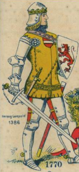
Herzog Leopold 1386