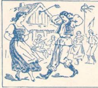
Zigeuner-Kostüm für ungar. Nationaltanz.