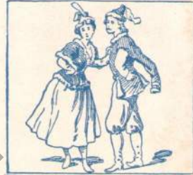
Poin. Kostüm für po'n. Nationaltanz.