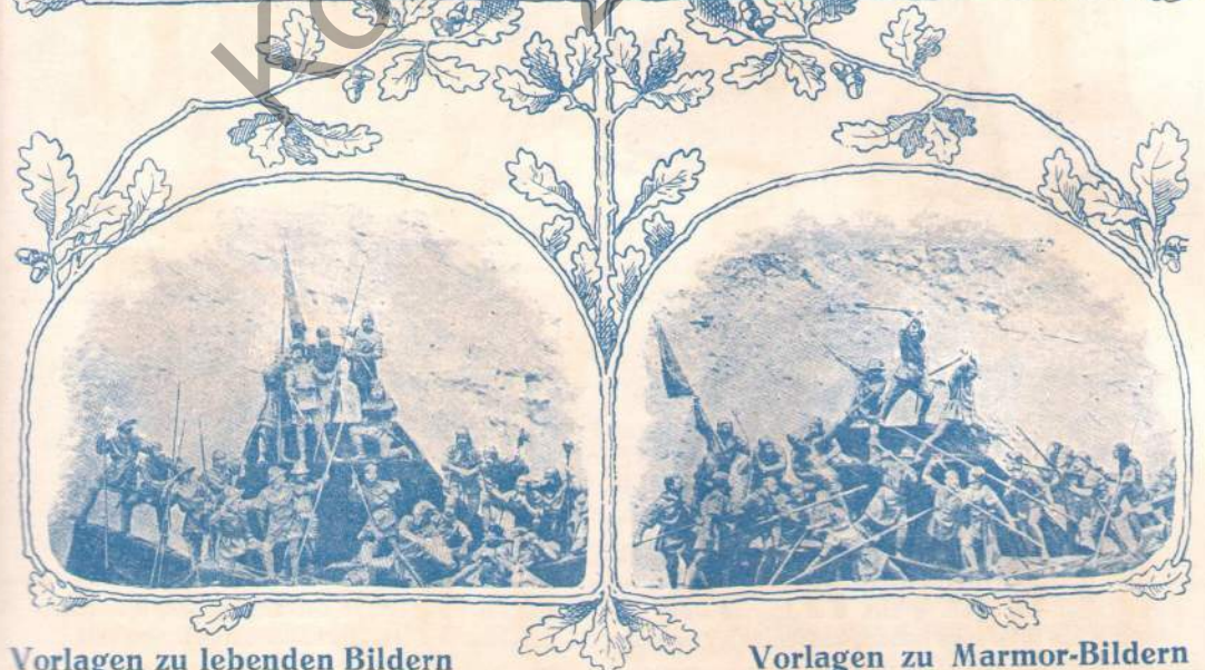
Vorlagen zu lebenden Bildern