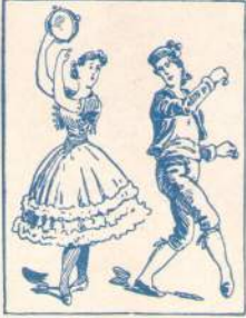
Spanier-Kostüm für span. Nationaltanz.