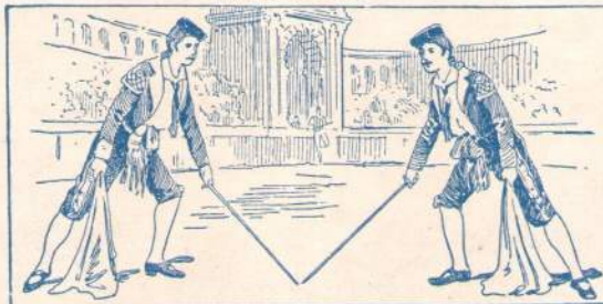
NEUHEIT: Spanischer Stierfechterreigen.

Perücken, Bärte, Schminke etc. zu obigen Kostümen passend sind stets lieferbar.